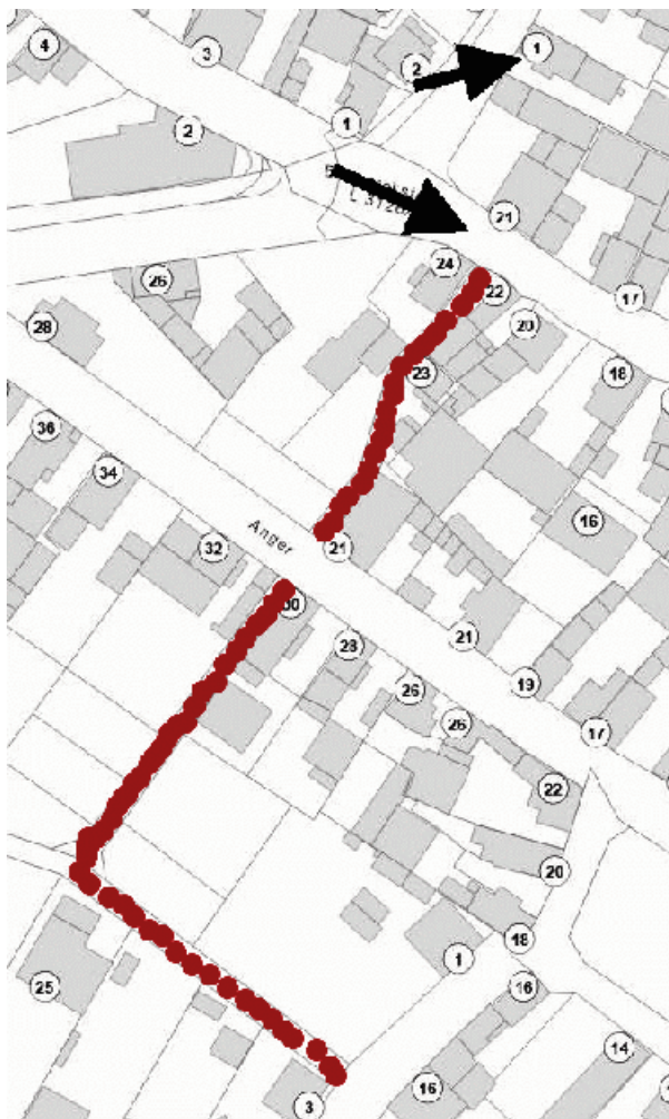
Modifizierter Ausschnitt aus natureg.hessen.de