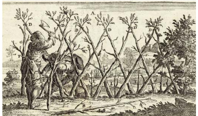
aus. Joh. Georg Krünitz: Oeconomische Encyclopädie . Band 16,

Im Jahr 1478 hatten die Busecker Ganerben von Kaiser Friedrich III. das Recht erhalten zwei ihrer Dörfer mit Graben, Zäunen und Bollwerken zu sichern. Dies haben sie später wohl auf weitere Dörfer ausgedehnt.