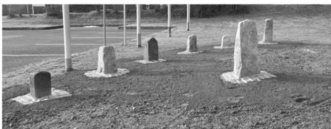
Lapidarium am Rathaus der Stadt Staufenberg (oben) Ausschnitt des Wappensteines mit Wappen v. Trohe und v. Buseck (rechts)