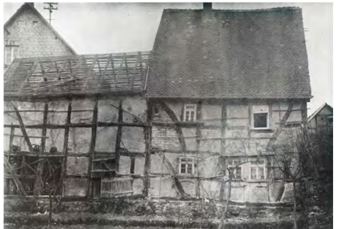
Angeblich !!! ältestes Schulhaus Großen-Busecks.

Bei der sog. Homberger Synode, die im Jahr 1526 in Homberg (Efze) stattfand kam es für Hessen zu einem entscheidenden Schritt. An der Synode nahmen Vertreter der geistlichen und weltlichen Landstände der Landgrafschaft Hessen teil, um in der Homberger Stadtkirche zu diskutieren, ob der protestantische Glaube in der Landgrafschaft eingeführt werden solle. Ein großer Fürsprecher dieser Idee war Landgraf Philipp I., der auch Initiator der Versammlung war. Die Mehrheit der Anwesenden auf der Synode unterstützten Philipps Vorhaben, und die Landgrafschaft wurde protestantisch.